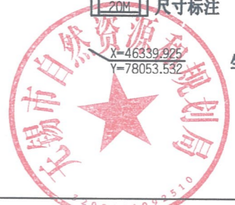
无锡市自然资源和规划局地块规划图